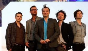
Večerní vystoupení kapely MIG 21